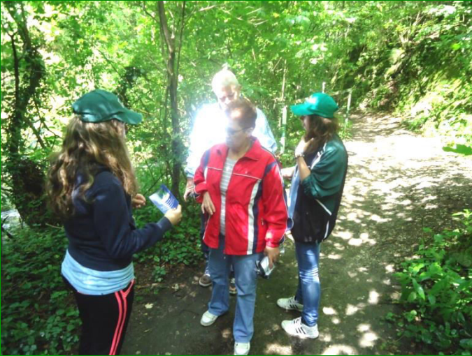
Activități ale voluntarilor în cadrul proiectului

▶ Publicații și materiale de vizibilitate: 2 pliante, broșură, poster, videoclip publicitar, link-uri pe pagina web www.gecnera.ro ,