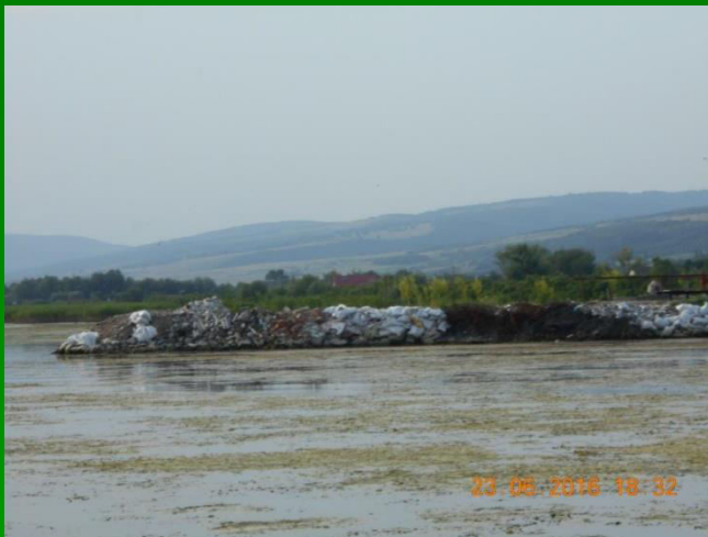
Deponie ilegală de deșeuri în albia Dunării la Moldova Veche .