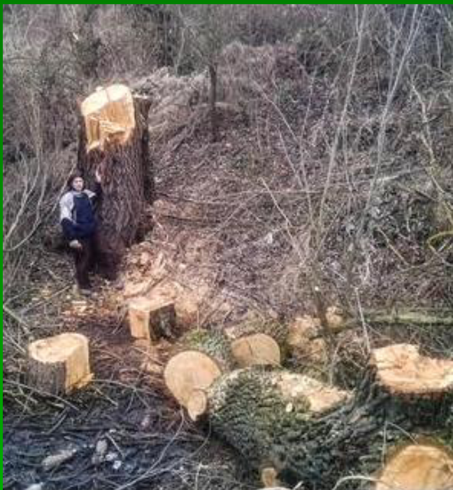
Activități ale voluntarilor în cadrul proiectului