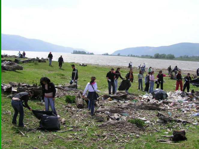
Ambalaje pe malul Dunării la Baziaș pe teritoriul comunei Socol.