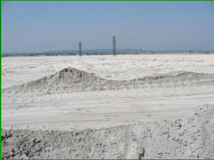
Deșeurile miniere de pe iazul Boșneag din Moldova Nouă o sursă permanentă de poluare în Clisura Dunării.